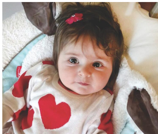
Cómodo y en paz en casa.